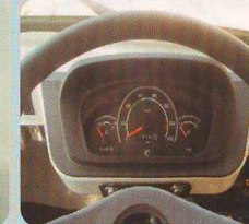
Stylish instrument panel