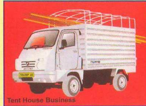
Tent House Business