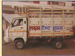
टेंट हाऊस व्यापार