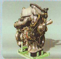
TD-2000 F DI Diesel Engine